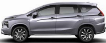
فضي معدني (U33) Blade Silver Metallic (U33)