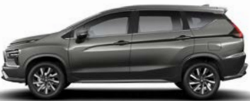
أخضر برونزي معدني (C31) Green Bronze Metallic (C31)