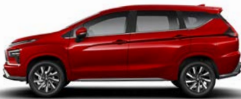
أحمر معدني (26) Red Metallic (P26)

Note: Colours shown may differ slightly from actual colours due to the printing process. Please consult your local Mitsubishi Al Habtoor Motors Showroom for actual colours. Some equipment may vary by market. Please consult your local Mitsubishi Al Habtoor Motors Showroom for details.