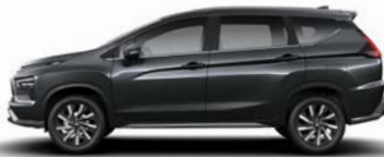
رمادي غرافيت معدني (U28) Graphite Grey Metallic (U28)