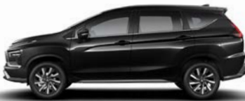
أسود ميكا (X37) Jet Black Mica (X37)