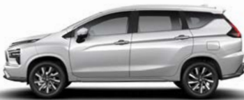
أبيض لؤلؤي كوارتز (W81) Quartz White Pearl (W81)